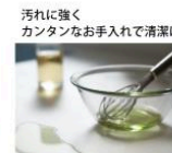
汚れに強く、カンタンなお手入れで清潔に