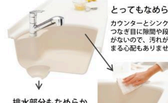
排水部分もなめらか