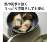
熱や衝撃に強く、うっかり直置きしても安心