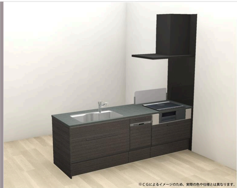
※C Gによるイメージのため、実際の色や仕様とは異なります。